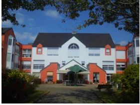
Résidence autonomie « La Peupleraie »